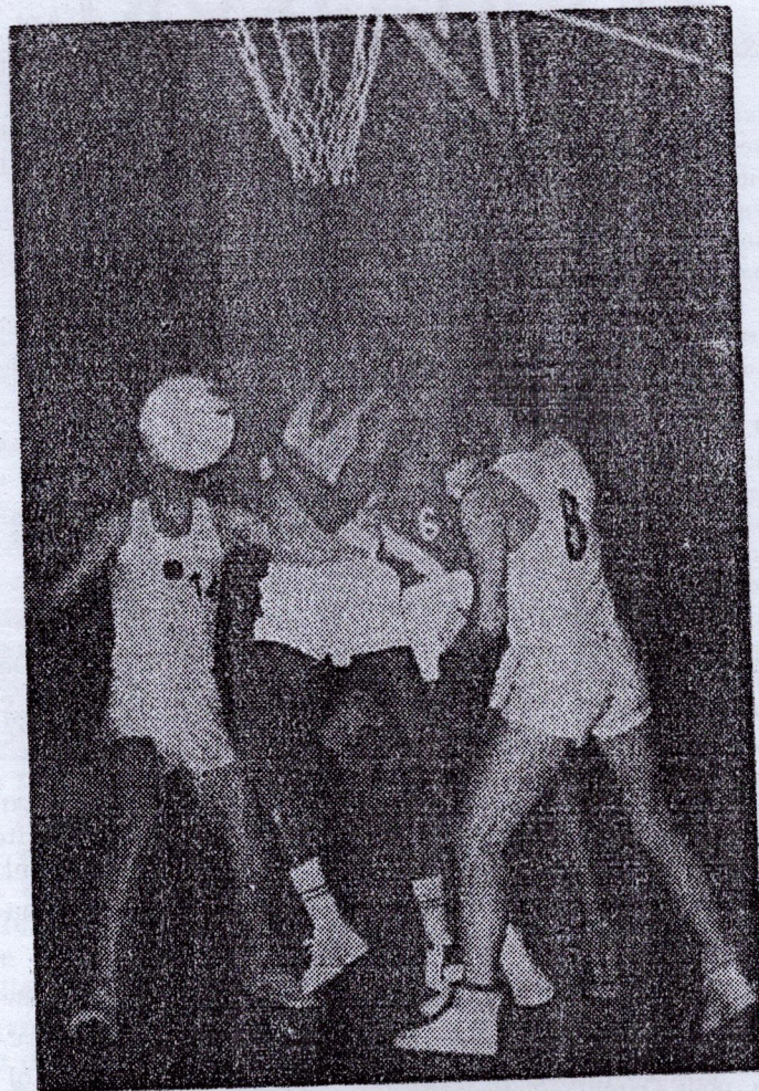
Une partie fort serrée du Jeu.